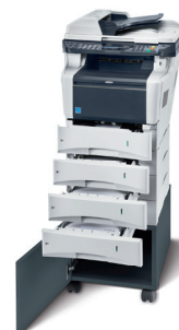
Abbildung mit Optionen.